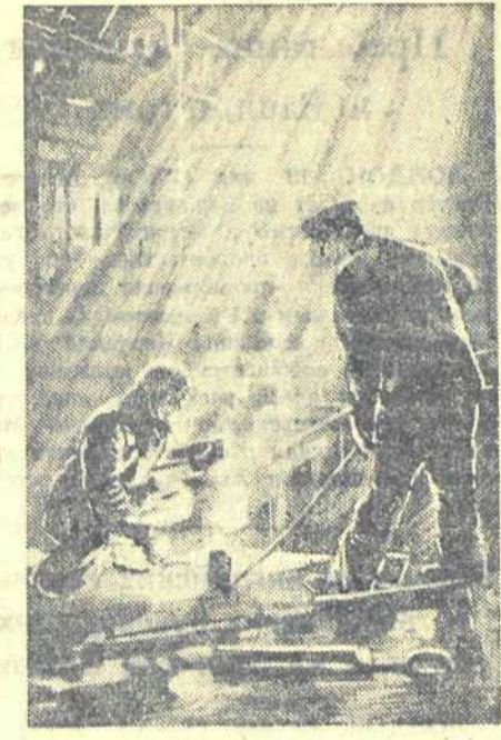
На П-ском заводе в Ленинграде. Электросварка.

Сегодня в Отечественной войне, войне справедливой, украинский народ под мудрым водительством Верховного Главнокомандующего Красной Армии, Маршала Советского Союза товарища Сталина мужественно бьется с гитлеровскими поработителями. Передовые народы мира с нами! Украина дышит, Украина живёт, борется!